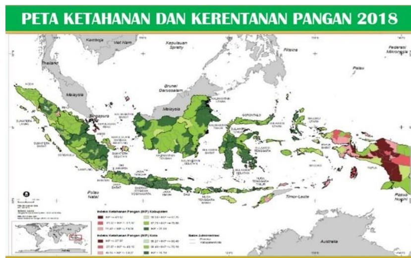
Gambar 1. Peta Ketahanan Pangan 2018

Pangan merupakan kebutuhan dasar manusia dan memiliki peran yang penting dalam pembangunan kualitas Sumber Daya Manusia. Oleh karena itu, ketersediaan pangan menjadi hal yang cukup penting dalam pemenuhan kebutuhan dasar manusia tersebut. Sebagai kebutuhan dasar dan salah satu hak asasi manusia, pangan mempunyai arti dan peran yang sangat penting bagi kehidupan suatu bangsa. Ketersediaan pangan yang lebih kecil dibandingkan kebutuhannya dapat menciptakan ketidakstabilan ekonomi. Berbagai gejolak sosial dan politik dapat juga terjadi jika ketahanan pangan terganggu. Kondisi pangan yang kritis ini bahkan dapat membahayakan stabilitas ekonomi dan stabilitas Nasional.