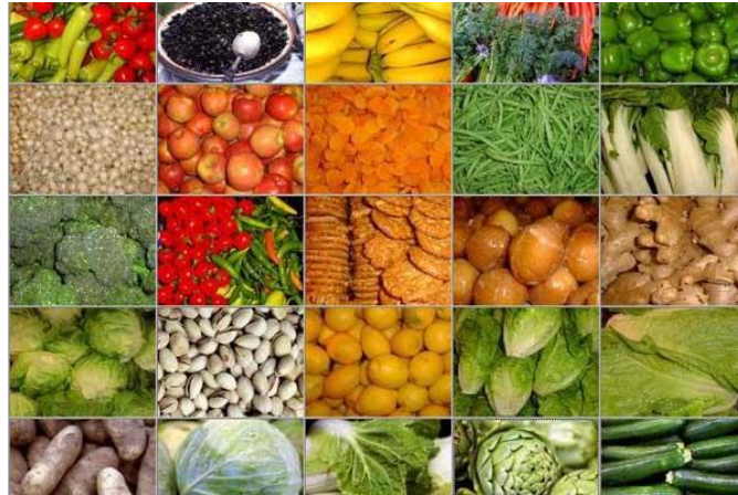
Gambar 2. Hasil Pertanian Hortikultura