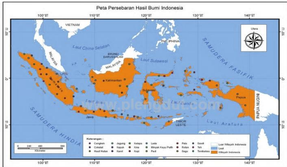
Gambar 3. Peta Persebaran Hasil Bumi Perkebunan

Jenis usaha perkebunan terdiri dari dua, yaitu usaha budidaya tanaman perkebunan dan usaha industri pengolahan hasil perkebunan. Berdasarkan jenis tanamannya, jenis perkebunan dibedakan menjadi dua yaitu perkebunan dengan tanaman musim (tanaman berumur pendek), dan tanaman tahunan. Sedangkan berdasarkan pengelolaannya, perkebunan dibedakan menjadi perkebunan besar dan perkebunan rakyat.