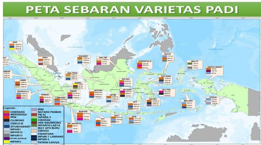
Gambar 2 Peta Persebaran Varietas Padi di Indonesia

Indonesia memiliki potensi ketersediaan lahan yang cukup besar dan belum dimanfaatkan secara optimal. Data dari kajian akademis yang dilaksanakan oleh Direktorat Jenderal Pengelolaan Lahan dan Air, Kementerian Pertanian pada tahun 2006 memperlihatkan bahwa total luas daratan Indonesia adalah sebesar 192 juta ha, terbagi atas 123 juta ha (64,6 persen) merupakan kawasan budidaya dan 67 juta ha sisanya (35,4 persen) merupakan kawasan lindung. Dari total luas kawasan budidaya, yang berpotensi untuk areal pertanian seluas 101 juta ha, meliputi lahan basah seluas 25,6 juta ha, lahan kering tanaman semusim 25,3 juta ha dan lahan kering tanaman tahunan 50,9 juta ha. Sampai saat ini, dari areal yang berpotensi untuk pertanian tersebut, yang sudah dibudidayakan menjadi areal pertanian sebesar 47 juta ha, sehingga masih tersisa 54 juta ha yang berpotensi untuk perluasan areal pertanian. Jumlah luasan dan sebaran hutan, sungai, rawa dan danau serta curah hujan yang cukup tinggi dan merata sepanjang tahun sesungguhnya merupakan potensi alamiah untuk memenuhi kebutuhan air pertanian apabila dikelola dengan baik. Waduk, bendungan, embung dan air tanah serta air permukaan lainnya sangat potensial untuk mendukung pengembangan usaha pertanian. Lahan