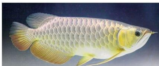
Gambar 4. Hewan ikan