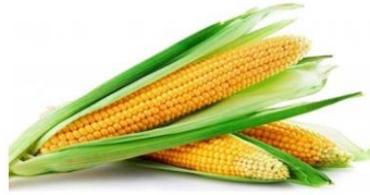
Gambar 3. Tanaman jagung