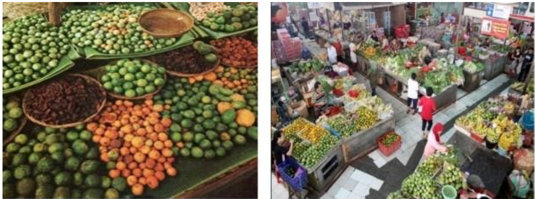
Gambar 1. Pengelompokan buah-buahan di pasar

Pasti kalian tidak asing lagi dengan situasi di pasar. Kalian akan melihat buah-buahan akan ditempatkan dalam satu lokasi, demikian juga dengan sayur-sayuran. Tidak akan ditemukam bahan pangan disatu wadahkan dengan bahan pembersih. Mengapa Demikian?? Pasti ada tujuan pengelompokkan ini. Apa dasar pengelompokkan dan manfaatnya? Untuk lebih jelas kita baca uraian materi secara seksama berikut ini!