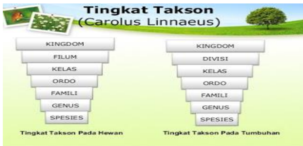
Gambar 2. Tingkatan takson Caroleus Linnaeus

Tingkatan takson pada klasifikasi yang digunakan oleh Linnaeus adalah sebagai berikut :